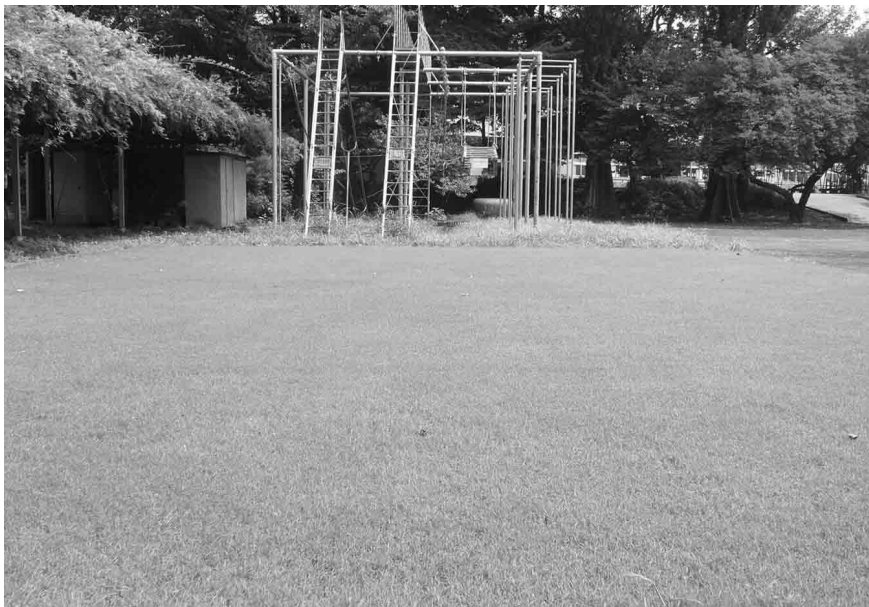
東京学芸大学附属世田谷小学校