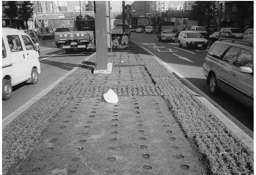
東京（五反田）・国道1号線