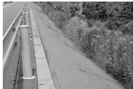
高速道路法肩防草