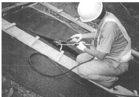
例) トーチバーナーによる加熱融着工法