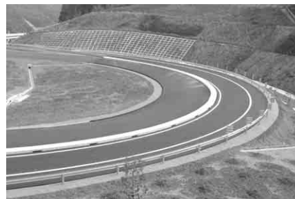
高速道路誘導廻り