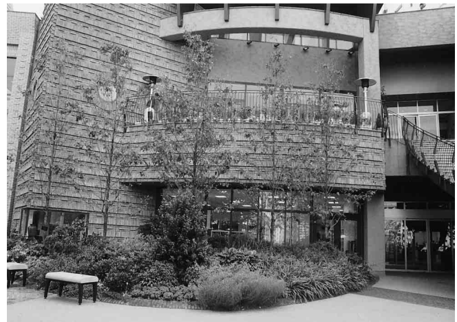
晴海トリトンスクエア

従来種と同様ウドンコ病やアメリカシロヒトリの発生に注意してください。 発生時にはオルトラン系薬剤等を適宜散布してください。