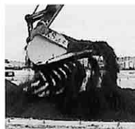
エコ炭攪拌状況 (飛散しにくい)