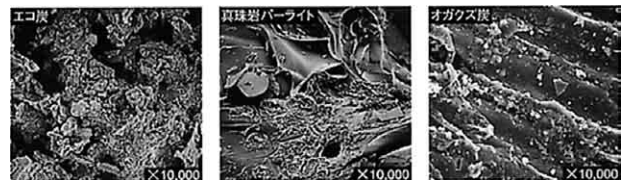
各資材の顕微鏡写真

非常に微細な孔隙は、驚異的な保水効果を発揮するばかりでなく、微生物にも格好の住みかを与える。また地温の安定、保肥力の増強にもつながり、さらに土壌中のガスを吸着したり、化成肥料などによる濃度障害を防いだりと、土壌の緩衝能力を高める役割も果たす。下記写真は内部構造を顕微鏡で観察したものである。エコ炭の表面積がきわめて多いことがわかる。