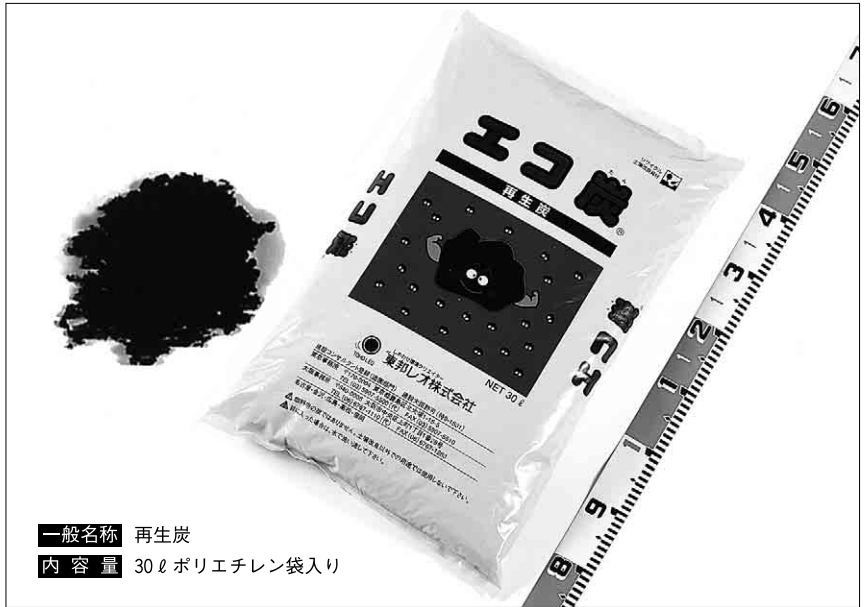
一般名称 再生炭 内容量 30ℓポリエチレン袋入り