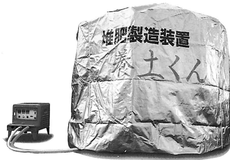
堆肥製造装置 “養土くん”

堆肥製造装置「養土くんシステム」は、今まで焼却処分されていた伐採樹木を最小限の労力と時間で良質な堆肥として再生する、新しい資源リサイクルシステムである。