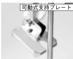
可動式支持プレート

調査地の傾斜に合わせて、支持プレートの角度を調節。傾斜地でも安定した調査が可能。