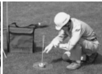
簡易現場透水試験器