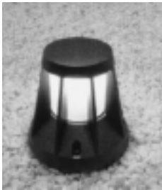
フットライト仕様