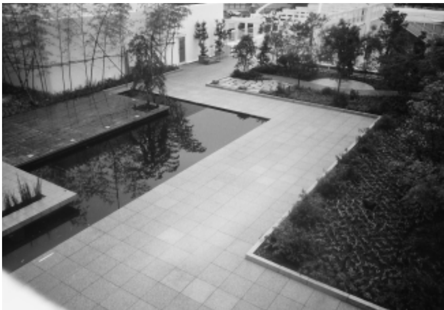
■乾式ロックパネル・乾式ストーンパネル（擬石）