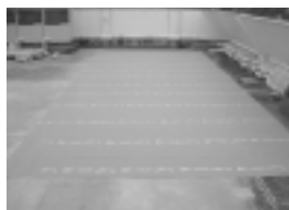
耐根シートの設置