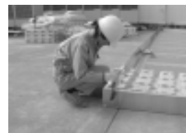
土留めパネルの設置