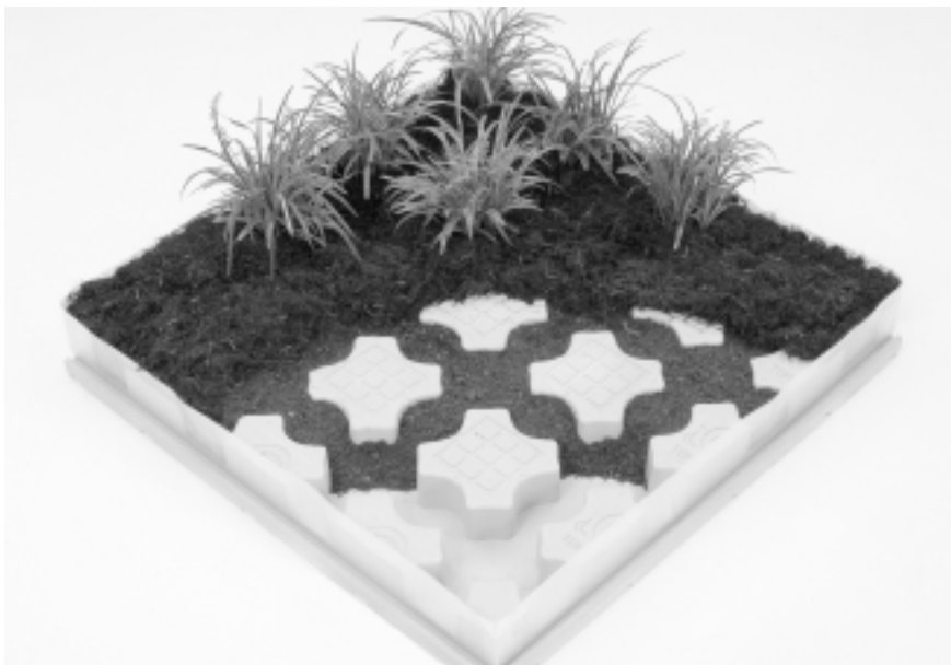
基盤を連結することで土壌の一体化を図ることができる

厳しい荷重制限（60kg/m 2 ）の中でも、多様な植物の導入を可能にした新開発の屋上緑化システム。生育基盤の中に嵩上げ部を設け、植物に必要な土壌厚を確保すると共に、基盤同士を連結することで土壌の連続性を確保する。生育基盤は底面貯水機能を有しており、保水力の強い人工土壌と自動灌水設備を標準装備することで、省メンテナンス化を図っている。