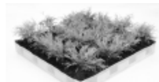
フィリフェラオーレア