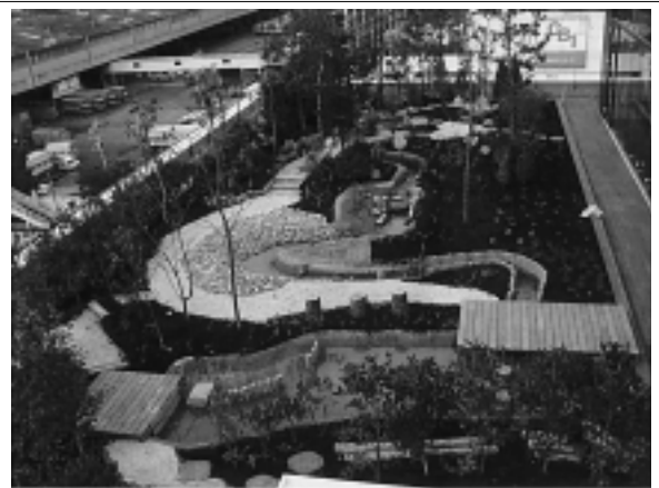
技術研究所 新本館 屋上ビオトープ『万葉の里』

底面かん水システムは、排水層に水を供給し、給水バルブ、排水バルブの開閉によって人工軽量土壌に水を均一に供給するシステムです。