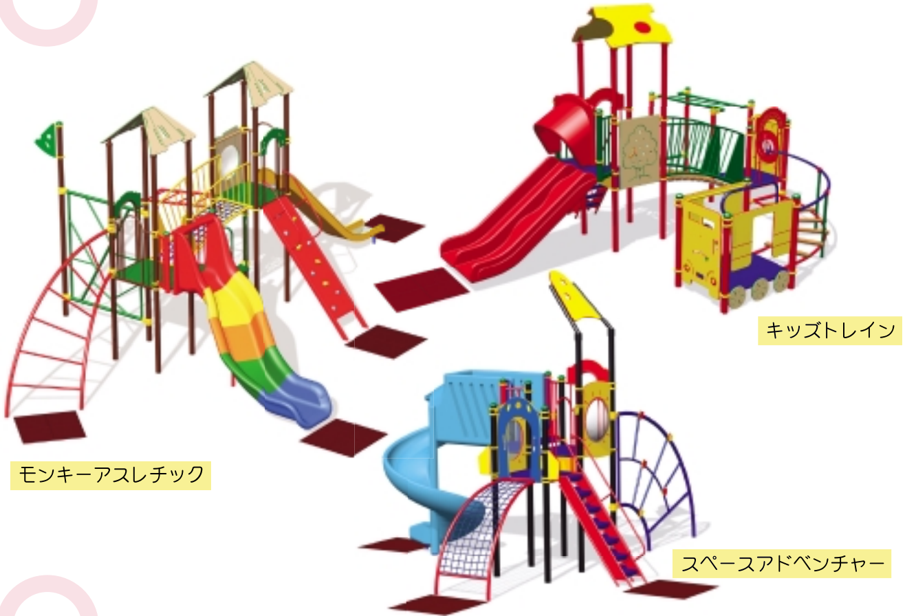
モンキーアスレチック