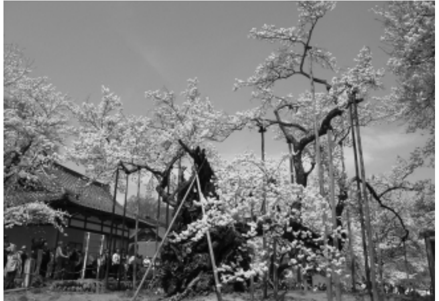
山梨県 山高神代桜（国指定天然記念物） OH-Cを用いた樹勢回復実施中