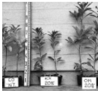
試験開始後1年7ヶ月。

マテバシイポット苗 (3年生) CONT: 赤土 (関東ローム) KX: バーク堆肥 (20%) OH: OH用高養分腐熟 堆肥 (20%) * 赤土に対する容積比