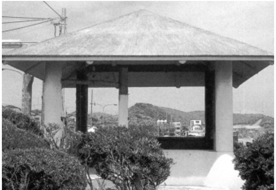
横須賀市 若山牧水休憩所 5400 × 5400 × 2950H

同社の「あずまや」は、創業以来の伝統技術に裏打ちされたデザインを豊富に揃えた自信作という。特徴としては檜木の温さと擬木の強さを組み合わせた仕上げ。あずまやが設置された公園・緑地などでは、利用者の憩いの場として落ち着いた雰囲気を印象づける。