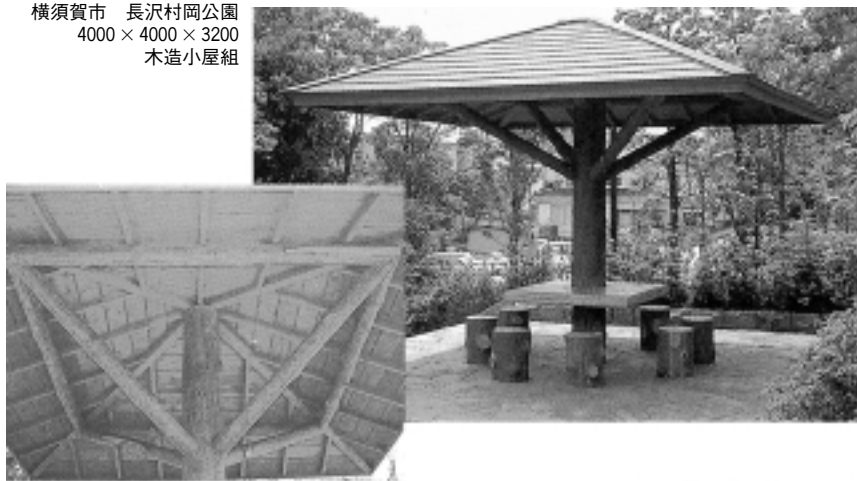
横須賀市 長沢村岡公園 4000 × 4000 × 3200 木造小屋組