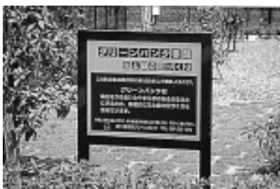
ダブルアルマイト 500 × 600 mm