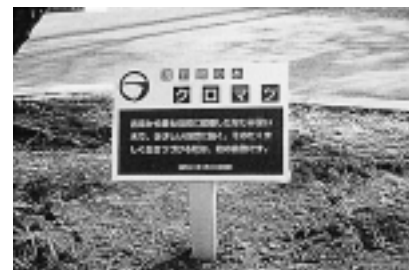
ダブルアルマイトL曲げ 200 × 300 mm