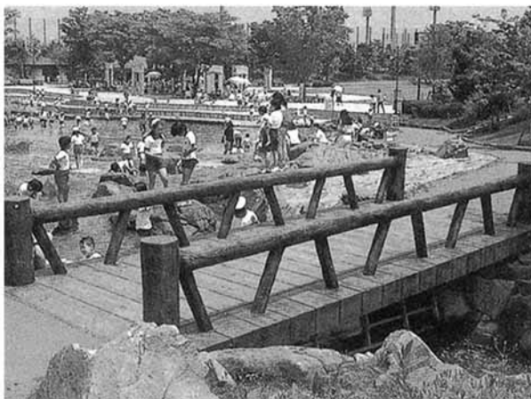
府中市 郷土の森 2000 × 5000 H600