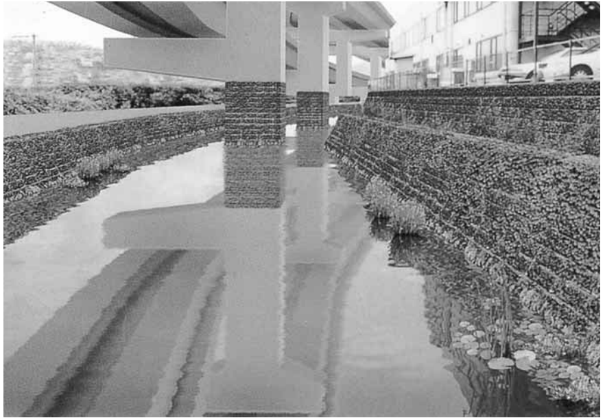
コンクリートの地肌もビオフィルムで覆うことで生態系に適した壁面となる（シミュレーション）