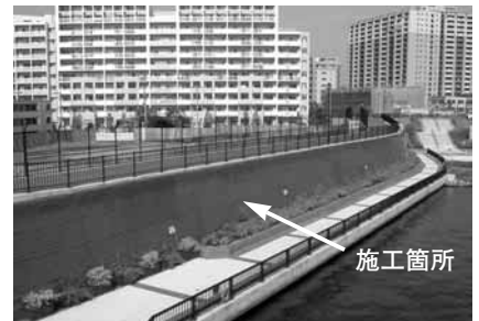
コンクリート堤防 隅田川の高潮対策として整備された古い堤防を緑化（東京都荒川区）