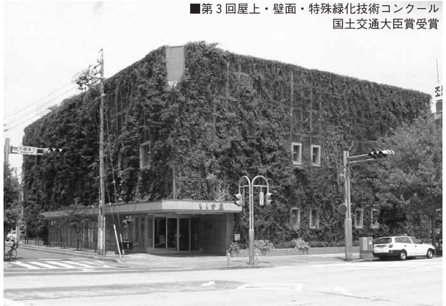
■第3回屋上・壁面・特殊緑化技術コンクール 国土交通大臣賞受賞

特徴3：設置時から自然な風合い 登ハンマットに天然素材のヤシ繊維を用いることで、設置時からの景観回復に機能を発揮。