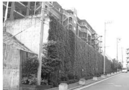
民間マンション外構 狭い植栽幅でも高い壁面まで緑化 (H=6m、神奈川県横浜市)