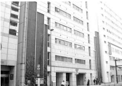
東京都壁面緑化モデル 省メンテナンス型の壁面緑化システムとして採用 (H=16m、東京都千代田区)