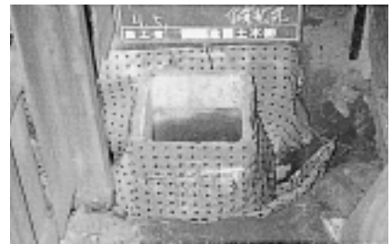
3. 包囲敷設法 四方から侵入する根茎を制御する。