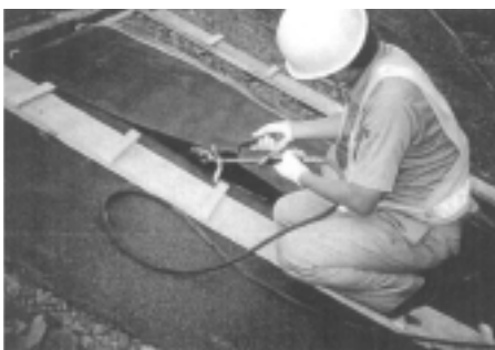
例) トーチバーナーによる加熱融着工法