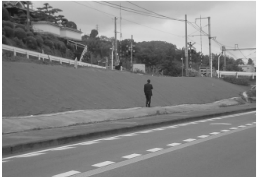
鉄道軌道法面防草施工例

このように、「アステクターU」は道路・軌道回りの景観を守り、道路脇等での危険な草刈作業等を無くし、メンテナンス費用の節減に大きく寄与するライフサイクルコストに優れた商品である。