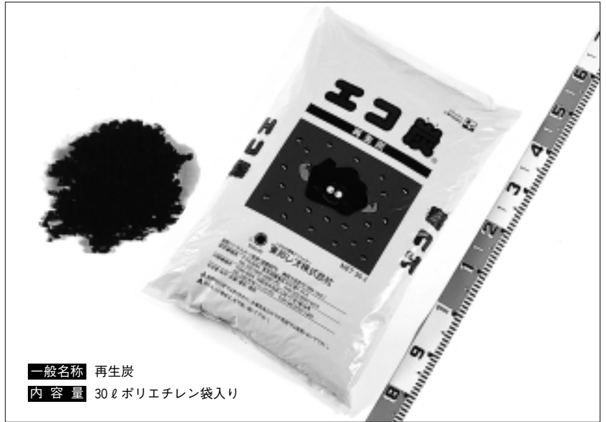
一般名称 再生炭 内容量 30ℓポリエチレン袋入り