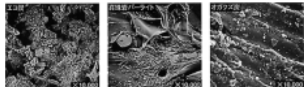
各資材の顕微鏡写真

非常に微細な孔隙は、驚異的な保水効果を発揮するばかりでなく、微生物にも格好の住みかを与える。また地温の安定、保肥力の増強にもつながり、さらに土壌中のガスを吸着したり、化成肥料などによる濃度障害を防いだりと、土壌の緩衝能力を高める役割も果たす。下記写真は内部構造を顕微鏡で観察したものである。エコ炭の表面積がきわめて多いことがわかる。