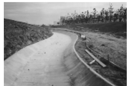
TMCモルタルの塗り込みおよび表面仕上げ