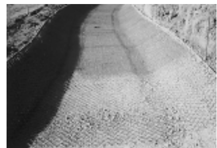
スペースメッシュ敷設 (アンカーピンにて押える)、スモールメッシュ敷設2層 (スペースメッシュに結束ピンにて結束)