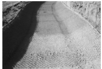
スパーサーメッシュ敷設 (アンカーピンにて押える)、スモールメッシュ敷設2層 (スパーサーメッシュに結束ピンにて結束)