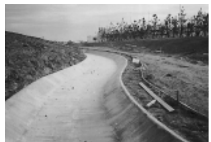
TMCモルタルの塗り込みおよび表面仕上げ