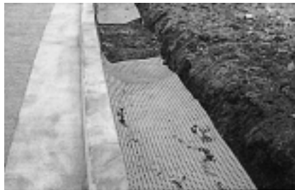
2. 水平敷設法 垂直に侵入する根茎を制御する。