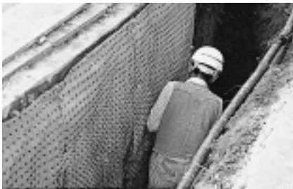
1. 垂直施工方法 横方向に侵入する根茎を制御する。