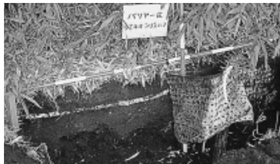
竹の地下茎の根止め