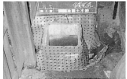
3. 包囲敷設法 四方から侵入する根茎を制御する。