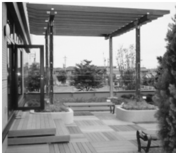
中部電力鈴鹿営業所 (三重県鈴鹿市) ▶ 使用商品: ウッドブロック900タイプ、大型パーゴラ (特注)、デッキ