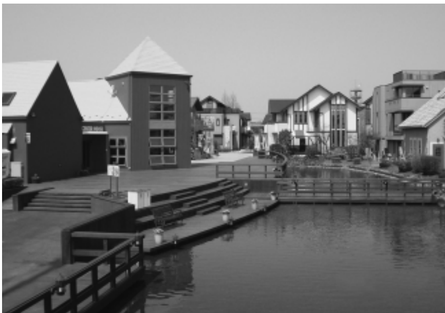
デッキ、柱材、他各種