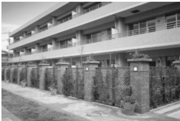
パーク・ハイム千歳烏山 (東京都世田谷区) 使用商品: フェンス、門扉