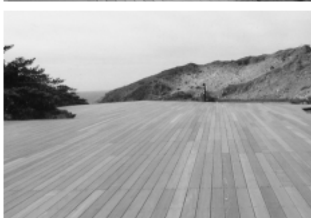
式根島遊歩道 (東京都新島村) 使用商品: デッキ、柱材、階段材など