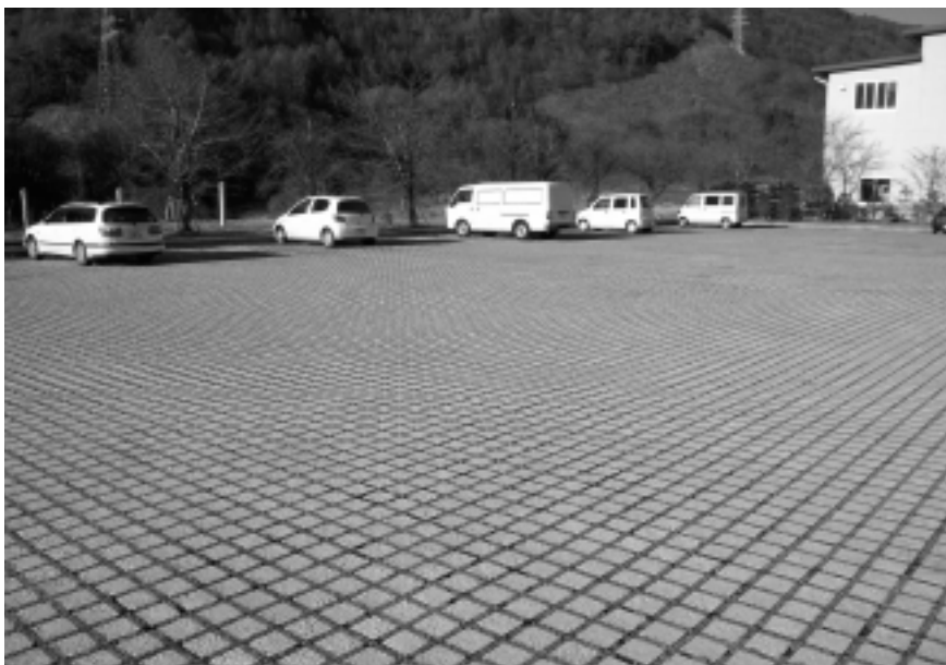
道の駅『信州蔦木宿』