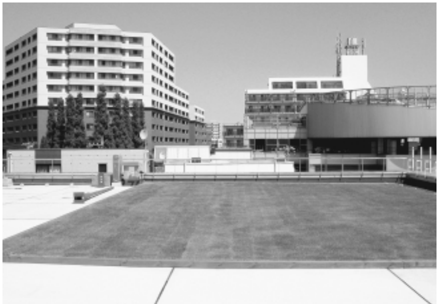
東京日産モーター桜新町店（延べ245㎡）