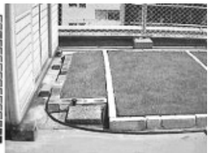
弊社屋上にて撮影（2004年8月2日13:00）