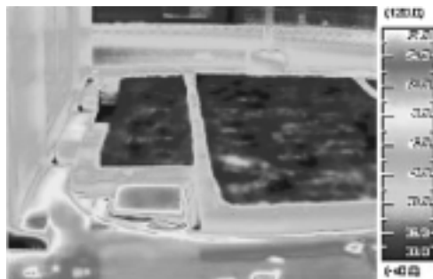
サーモグラフィ画像