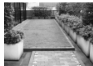
オフィスーフテラス