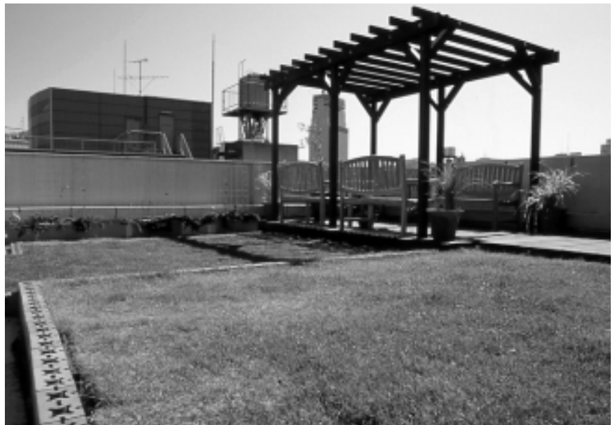
本社屋上（常時見学見学可能）