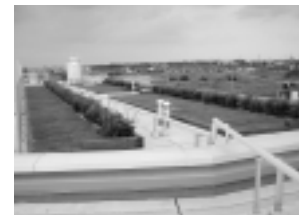
集合住宅屋上（共用部分）